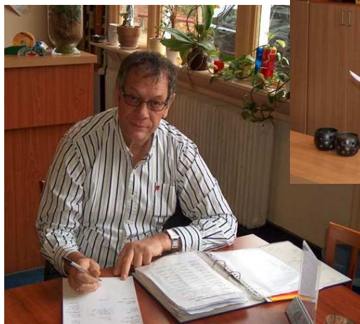
Beheerder aan het werk

DOEL 3: Een stabiel en kwalitatief goed beheer voor wijkaccommodaties om deze nog beter te kunnen benutten en effectiever in te zetten voor beleidsdoelstellingen zoals die van de WMO.